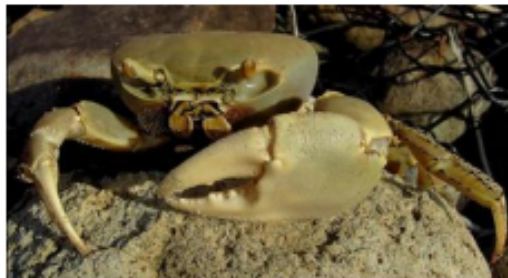
Imagen 1. Imagen de referencia en la que se aprecian los caracteres diagnósticos de Cardisoma guanhumi (cangrejo azul).

El caparazón de Cardisoma guanhumi puede alcanzar tamaños de hasta alrededor de 11 cm y tamaños globales que alcanzan los 35 cm. Al igual que muchos cangrejos poseen quelas dimórficas; la más grande puede crecer hasta unos 15 cm de longitud, (llegando a ser más grande que propio caparazón). Los ojos son achatados y sus pedúnculos de colores de un azul profundo a un gris pálido. Los adultos tienen un color azul grisáceo, mientras que los jóvenes suelen ser anaranjados o marrones, su caparazón alcanza 16 cm de diámetro. Esta especie puede llegar a pesar más de 500 g (Arteta y Reynaldo, 2009) (Imagen 1).